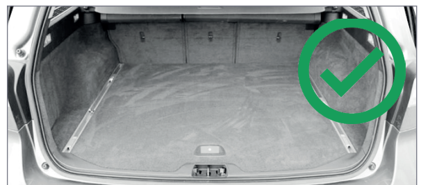
Bagageutrymme utan tröskel fungerar vid trucklastning.

OBS! Om hela förpackningen inte kan lastas med truck måste kund på egen hand ombesörja ompackning och lastning.